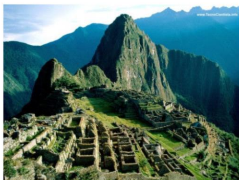
Vista das ruínas de Machu Picchu