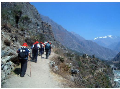
Trilha para Machu Picchu