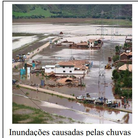
Inundações causadas pelas chuvas

(...) O Ministério de Relações Exteriores do Brasil não soube informar se há brasileiros entre os turistas já resgatados, mas relata que as operações nos últimos dois dias foram mais lentas e prejudicadas pelo mau tempo.